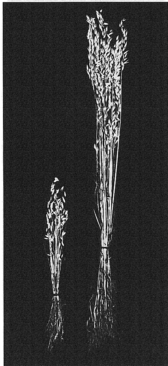
Dessin no 1 Influence de localisation de la distribution d'ammoniaque dans les sols. A droite: Avoine prise dans la rangée où a été apporté l'ammonium. A gauche: Avoine prise dans la rangée distante de 30 cm de la ligne d'apport.